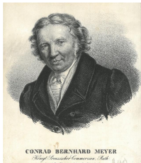
rechts: Conrad Bernhard Meyer (1755–1830) auf einer nach einem Selbstporträt gefertigten Litho- grafie (nach 1830) (NLA AU, Rep. 243, B 34)