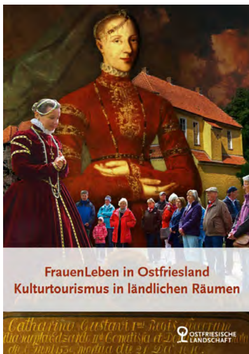
Abb. 11: Cover der Download-Broschur „FrauenLeben in Ostfriesland“