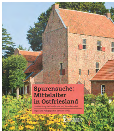
Abb. 7: Cover der Arbeitsmappe „Spurensuche: Ostfriesland im Mittelalter“ mit Unterrichtsmaterial zur Regionalgeschichte für Grundschule und Sekundarstufe I (Landchaftsbibliothek Aurich, y 12716)

Die Arbeitsgruppe der Ostfriesischen Landschaft, der LWL-Archäologie (NRW), der Ruhr-Universität Bochum, der Universität und Landesarchäologie Bremen, des Niedersächsischen Instituts für historische Küstenforschung und des Niedersächsischen Landesamts für Denkmalpflege hat das Projekt „Mensch und Raum – die westgermanische Kulturlandschaft während der römischen Kaiserzeit“ bei den Akademien der Wissenschaften in Göttingen vorgelegt. Das Gutachterverfahren wird sich bis 2021 hinziehen, bevor über das Projekt in einem Wissenschaftsausschuss entschieden wird, der sich aus Vertretern des Bundes und der Länder zusammensetzt. Angestrebt ist für das Projekt eine Laufzeit von 2022 bis 2040.