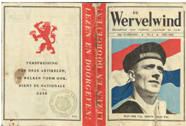
Abb. 2: Deckblatt des Propaganda-Flugblatts von „De Wervelwind“. Diese seit 1942 in London veröffentlichte Zeitschrift wurde von der Royal Air Force über den Niederlanden abgeworfen (Landschaftsbibliothek Aurich, Ms 415, 1,6).