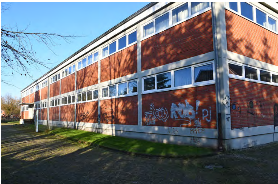
Abb. 1: Die Kleiderkammer bei der Auricher Kaserne soll zum Magazin umgebaut werden (Foto: Reinhard Former, Ostfriesische Landschaft).

Die Ostfriesische Landschaft hat sich erfolgreich um Fördergelder zur Realisierung des „Sammlungszentrum für historisches ostfriesisches Kulturgut“ bemüht. Die Finanzierung der geschätzten Gesamtkosten in Höhe von 2,24 Mio. Euro wird durch das Niedersächsische Ministerium für Wissenschaft und Kultur mit 250.000 Euro, die NBank bzw. durch EFRE-Mittel mit 530.750 Euro und durch den Beauftragten der Bundesregierung für Kultur und Medien mit 854.000 Euro gefördert. Eine europaweite Ausschreibung ist in Auftrag gegeben.