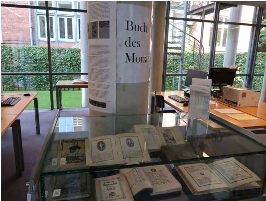
Abb. 4: Ausstellung zum „Buch des Monats“