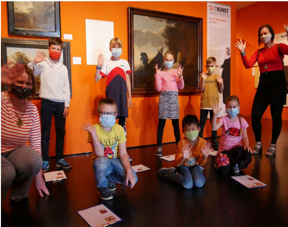
Abb. 8a: Die „Sommerkinder“ in der Sonderausstellung „200 Jahre 1820dieKUNST – Aus der Schatzkammer ans Licht“

Ab Ende Mai des Jahres 2020 wurde es durch die pandemiebedingte Schließung des Landesmuseums notwendig, Anpassungen in der Ausstellungsplanung vorzunehmen. Im Zuge der daraus hervorgehenden Adaptionen für den Sommer und den Herbst des Jahres wurde die ursprünglich als Kabinettausstellung für einen späteren Zeitpunkt angedachte Sonderausstellung „Komplizenschaft. Die Sammeltätigkeit von ‚Kunst‘ und Stadt Emden während der NS-Zeit im Fokus der Provenienzforschung“ 8 für den Zeitraum vom 8. November 2020 bis zum 27. Januar 2021 avisiert.