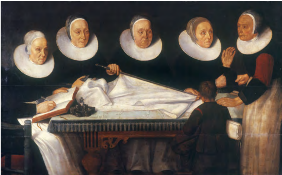
Abb. 14: Alexander Sanders: Die Vorsteherinnen des Emders Gasthauses, Öl auf Leinwand, 17. Jahrhundert, im 2. Obergeschoss des Ostfriesischen Landesmuseums Emden

Viele Exponate des Ostfriesischen Landesmuseums Emden zeigen, dass sich bestimmte Emotionen, Probleme und Ängste der Menschen von heute vielleicht gar nicht so sehr von denen vergangener Generationen unterscheiden. Gemälde wie Alexander Sanders' Vorsteherinnen des Emders Gasthauses aus dem 17. Jahrhundert haben plötzlich einen brandaktuellen Bezug zur Gegenwart. Dargestellt