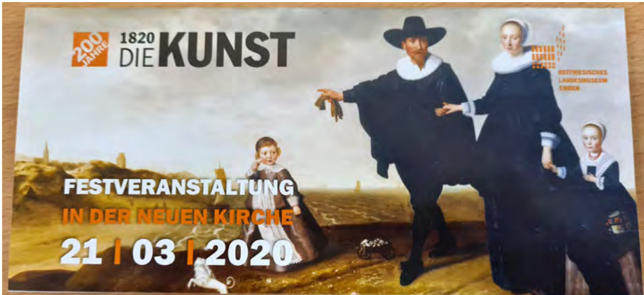
Abb. 1: Einladung zur Festveranstaltung (Gestaltung Sebastian Fröhlich), verschoben wegen der Corona-Pandemie nach 2022

möglich war das jedoch mit der bereits fertiggestellten Informationsbroschüre. 3 Gestaltet als Beilage zur März-Ausgabe des „Ostfriesland Magazins“ (Redaktion Silke Arends) war die Auslieferung im Abonnement (mehr als 10 Tsd. Exemplare) schon erfolgt und weitere 5 Tsd. Hefte zur Auslage in Arztpraxen, Volkshochschulen u.a. verteilt.